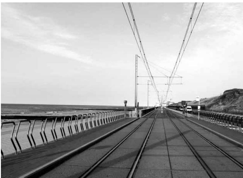
Raversijde (près d'Ostende), photo Th. Beaufils.

La côte s'organise aussi à partir d'une multitude de traits, souvent tirés à la règle: les caténaires, les voies et les fils électriques de la ligne de tram, les routes, des barres d'immeubles bariolés de pancartes te huur (à louer) ou te koop (à vendre), les digues, les plages de sable, les pétroliers et les cargos au loin posés sur la ligne d'horizon, les cabines de plages zébrées, les forêts de paravents. Le littoral, c'est aussi une ancienne ligne de front. Albert I er , le roi-soldat, s'est retranché à La Panne pendant la Première Guerre mondiale, alors que la presque totalité de la Belgique était aux mains des Allemands. Un monument lui rend d'ailleurs hommage près de Nieuwpoort, facilement accessible grâce au tram. Dans les dunes aux alentours du domaine de Raversijde, des vestiges du mur de l'Atlantique (canons, tranchées, passages souterrains) visité par Rommel en 1943, rappellent l'autre guerre, un autre front. Les piers (plus particulièrement celui de Blankenberge, magnifique), ces avancées insolites bâties sur l'eau, perturbent cette stratification invariable. Ils nagent au beau milieu de la mer à contre-courant des logiques parallèles. Les plages sont aussi coupées à intervalles réguliers par des barrières de pavés, les brise-lames, sortes de gendarmes des mers plantés là pour rappeler les vagues à l'ordre lorsqu'elles sont trop criminelles. Quelques phares surveillent indéfectiblement ce campement.