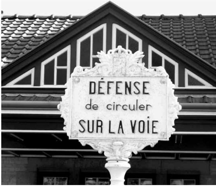
Le Coq (De Haan)