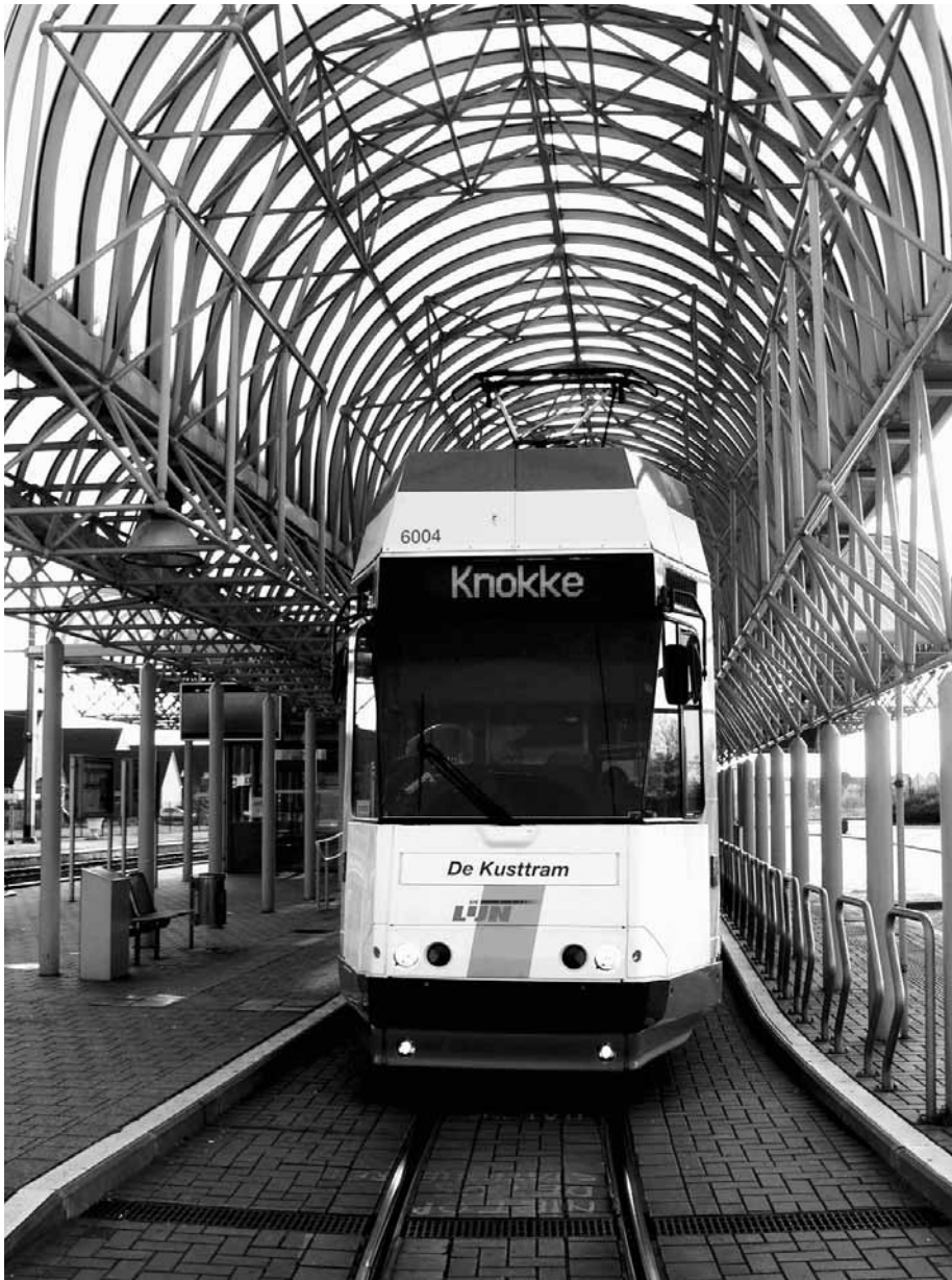
Le départ à La Panne.