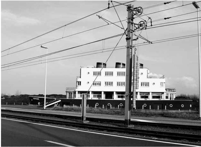
L'hôtel-bateau Normandie à Coxyde (Koksijde), photo Th. Beauflis.