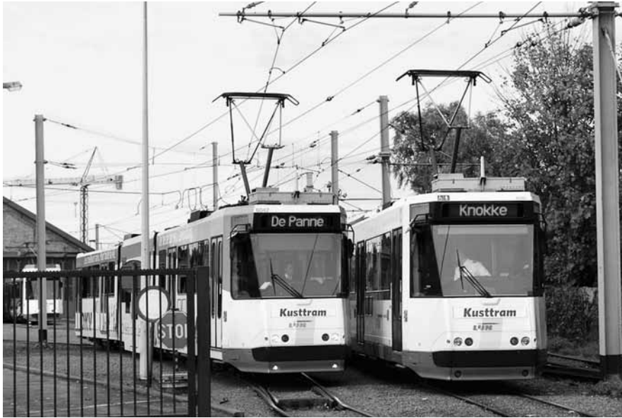
Le dépôt des tramways à Knokke.

soigneusement tracés, ineffaçables. La transgression de ces alignements l'ouvre à un autre espace onirique incommensurable, forcément aussi très séduisant.