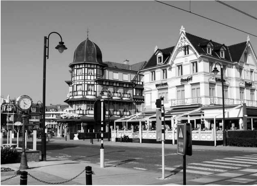
Le Coq (De Haan), photo Th. Beaufils.

Léopold II y fit construire sa résidence d'été. Les superbes galeries royales relient la villa royale au très aristocratique hippodrome Wellington. Les parents de Liliane Baels, la seconde épouse de Léopold III, sont Ostendais. C'est tout dire! Avant que les hordes barbares ne se ruent sur ces rivages enchantés, les patriciens s'adonnaient en toute quiétude aux doux plaisirs balnéaires. Zita, l'impératrice d'Autriche et reine d'Hongrie, séjourna à Wenduine.