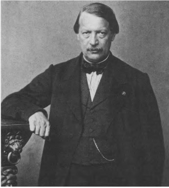
Henri Conscience (1812-1883).

Quand le septentrion Baisera le couchant Ce sera fin de ruines: Cherche la ceinture.