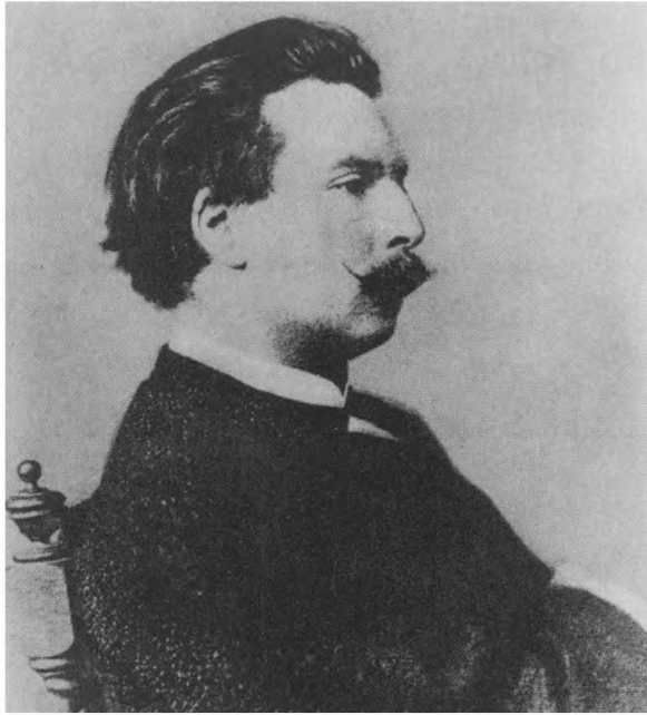
Charles de Coster (1827-1879).

francophones, s'ingénie à glorifier la Belgique. Son but ne différait donc en rien de celui de ses collègues écrivant en français. Je cite la célèbre phrase finale : «Vous, Flamand qui avez lu ce livre, considérez, à la lumière des exploits glorieux qu'il contient, ce qu'était la Flandre autrefois, ce qu'elle est maintenant, et plus encore ce qu'elle sera, si vous oubliez les exemples sacrés de vos ancêtres» (ma traduction). A partir de la situation politique actuelle, celle d'une Belgique fédéralisée contenant deux communautés quelque peu rivales, le Flamand d'aujourd'hui interprète cet appel spontanément comme une invitation à tenir tête aux francophones du pays. Et pourtant, le Flamand qu'envisage Conscience est en fait un Belge, soucieux des exemples «sacrés» (!) de ses ancêtres, et appelé à combattre la France «perverse». Le «bon Flamand» de Conscience incarne donc le Belge idéal, c'est-à-dire, le Belge conscient de son passé flamand, pieux et catholique. «L'ennemi» n'est donc pas dans les murs, mais à l'extérieur!