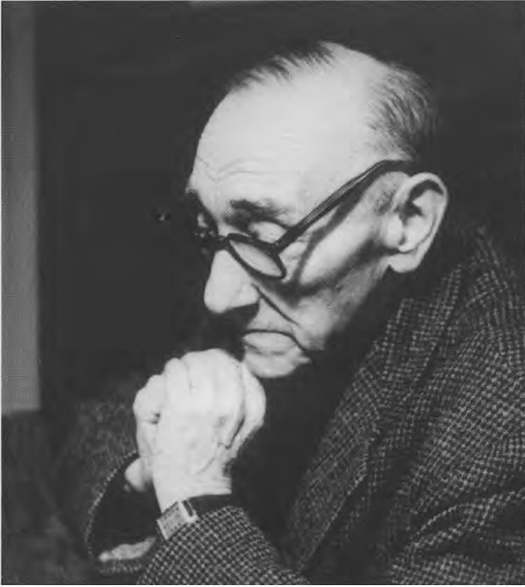
Jean Ray (pseudonyme de Raymond Jean Marie de Kremer, 1887-1964).

(1872-1945), auteur et rédacteur de la revue Van Nu en Straks . Mais il faut reconnaître que, pour l'instant, la littérature en néerlandais emprunte encore les voies suivies par la littérature de France. Le titre même de la revue de Vermeylen devrait son nom à une revue française de Charles Morice, La littérature de tout à l'heure (1889). Vermeylen a d'ailleurs reconnu en 1901 sa dette à l'égard de ses collègues francophones lorsqu'il déclara que les fondateurs de sa revue se sentaient le plus proches des auteurs français de Belgique.