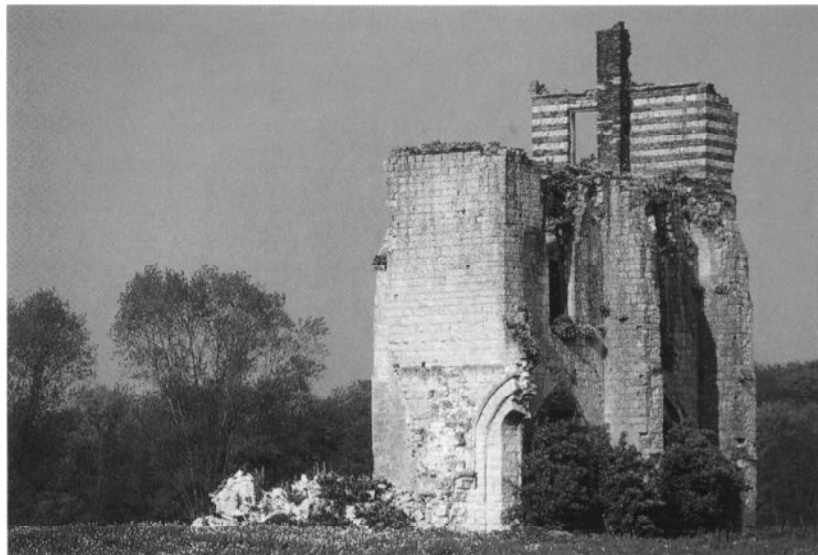
Resten van de abdij van Clairmarais