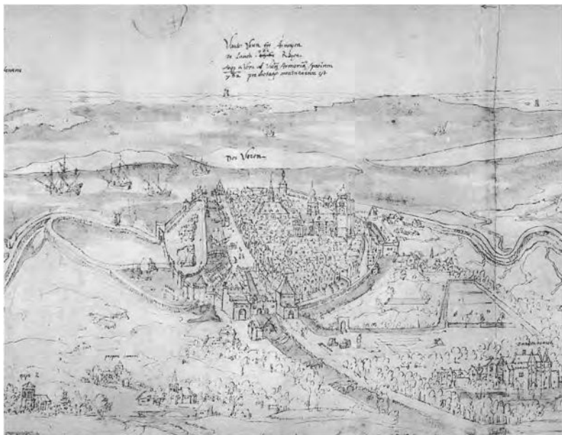
Veere omstreeks 1550. Rechtsonder kasteel Zandenburg, de residentie van de heren van Veere. Jaarlijks legden de vice-admiralen van Vlaanderen hier financiële verantwoording af. Detail uit de "Zelandiae Descriptio" van Anthonie van Wijngeerde, midden zestiende eeuw. (Antwerpen, Nationaal Scheepvaartmuseum)

voortdurend admiralen hadden gefunctioneerd(12), bekleedden na de uitvaardiging van de eerste ordonnantie op de admiraliteit in 1488 geen Vlamingen maar Zeeuwen het ambt van admiraal-generaal. Tot 1558 waren het de heren van Veere die als hoogste maritieme functionaris van de vorst optraden. Als machtigste edelen van het tussen Vlaanderen en Holland gelegen Zeeland bezaten zij een goede uitgangspositie voor de uitoefening van het admiraalsambt.(13) Zeeland was van groot strategisch belang in verband met de toegang tot de metropool Antwerpen.