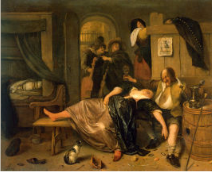
Jan Steen, Het dronken paar (Le Couple ivre), huile sur panneau, vers 1655-1665, Rijksmuseum, Amsterdam.