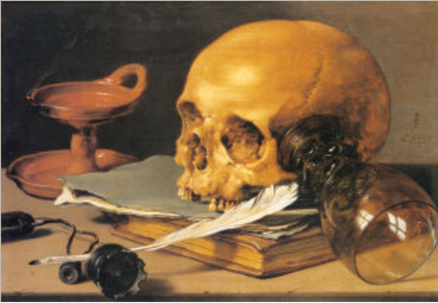
Pieter Claesz., Vanitasstilleven met doodshoofd, schrijfgerei, boek, roemer en olielampje (Vanité avec tête de mort, matériel d'écriture, livre, verre à vin et petite lampe à huile), huile sur bois, 1628, The Metropolitan Museum of Art , New York.

boire ferait bien de suivre: «Le vin doux augmente le désir, mais n'en bois pas trop, car alors tu seras épuisé / Le feu est ranimé par le vent, mais trop de vent l'éteint».