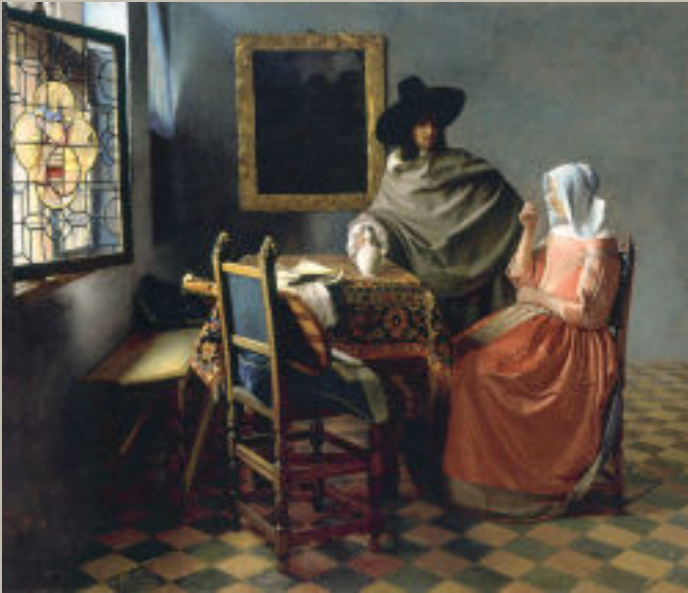
Johannes Vermeer, Het glas wijn (Le Verre de vin), huile sur toile, 1660, Gemäldegalerie, Berlin.